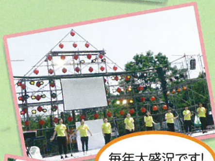
毎年大盛況です! 見に来てね♡