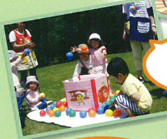
アンパンマンとドキンちゃんが応援に来たよ!