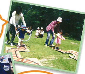
あつい日だったけど頑張ったね