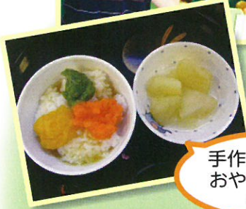
手作り離乳食やおやつも出しています