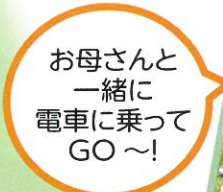
お母さんと一緒に電車に乗ってGO～!